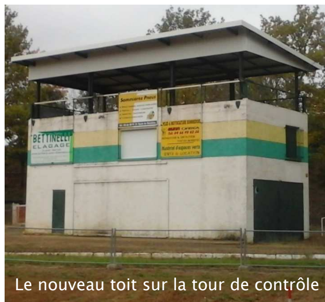
Le nouveau toit sur la tour de contrôle