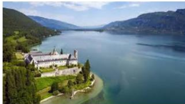
LAC DU BOURGET L' ABBAYE DE HAUTECOMBE