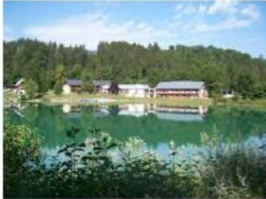
L'EAU VIVE LESCHERAINES