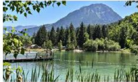
BASE DE LOISIR LESCHERAINES